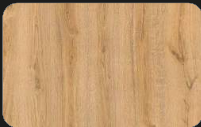
CPL06 Roble Jarama