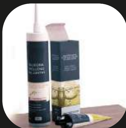
Sellador de juntas Silicona de relleno