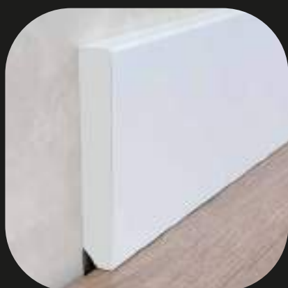
Rodapié blanco Base PVC espumado - lacado blanco