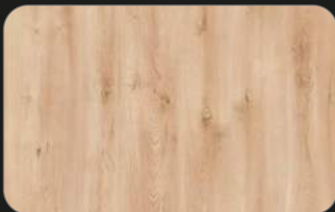
CPL07 Roble Calafat