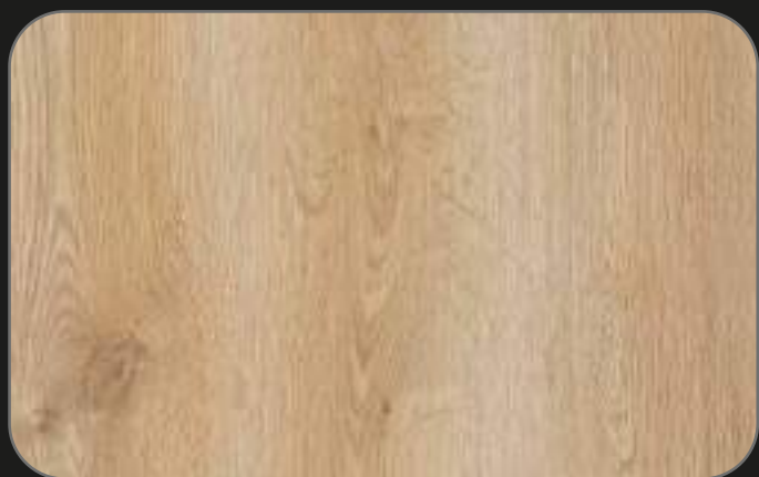
CPL08 Roble Estoril