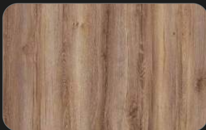
CPL03 Roble Jerez