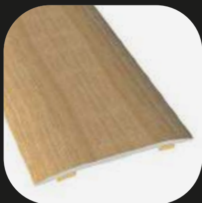
Perfil de expansión Base de aluminio Adhesivo

Accesorios disponibles para todas nuestras gamas de productos.