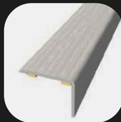
Cantonera Base de aluminio Adhesivo