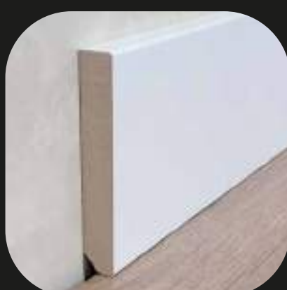
Rodapié blanco Base MDF - lacado blanco - laminado blanco