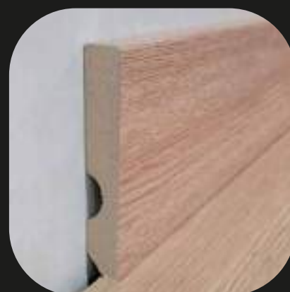
Rodapié laminado Base MDF - laminado