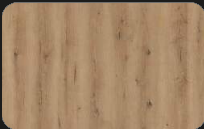
CPL01 Roble Monza

Tamaño pieza: 1.200 x 191 x 8 mm 1,83 m 2 /caja