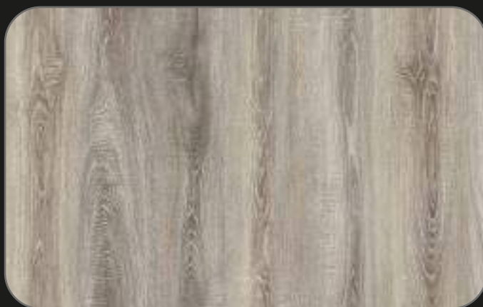
CPL04 Roble Misano