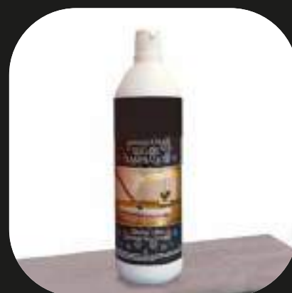
Limpiador para suelos laminados