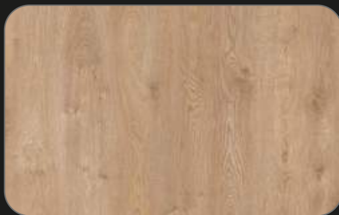
CPL09 Roble Cheste

* Probado de acuerdo con la prueba de hinchamiento de superficie laminada de NALFA y de acuerdo con ISO 4760 (resistencia a la humedad tónica: ① junta ensamblada).