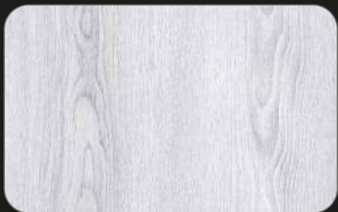
CPL05 Roble Assen